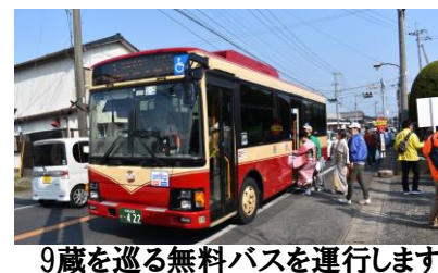
9蔵を巡る無料バスを運行します