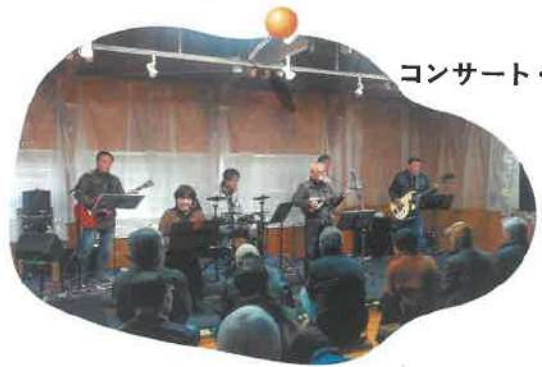
コンサート・発表会