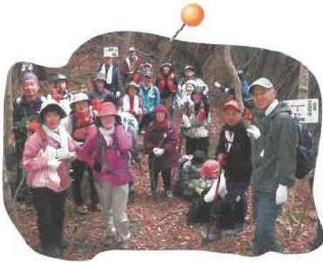
登山・ハイキング